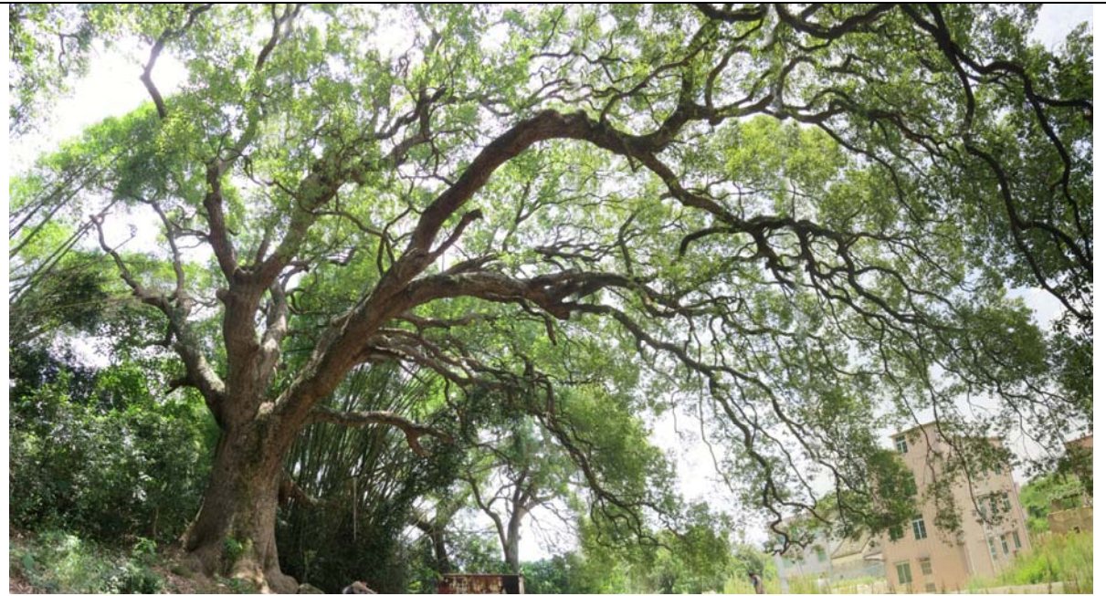
古樹名木編號 AFCD/HT/024 的外觀