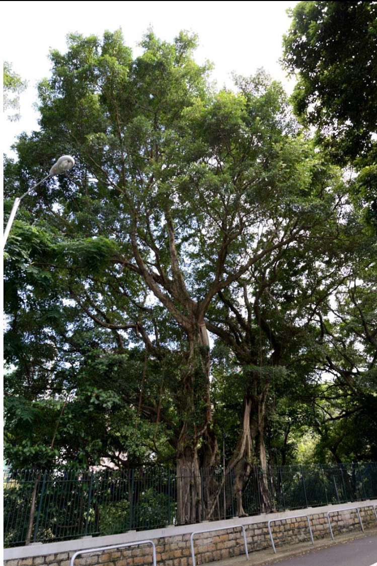
古樹名木編號 ArchSD CW/6 的外觀