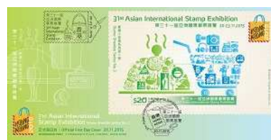
貼有一張郵票小型張並以特別郵戳蓋銷的首日封