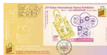
貼有一張郵票小型張並以特別郵戳蓋銷的首日封