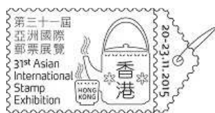
香港 2015——第三十一屆亞洲國際郵票展覽