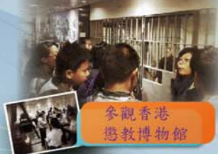
參觀香港懲教博物館