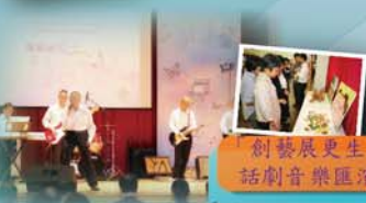
「創發展更生」話劇音樂匯演