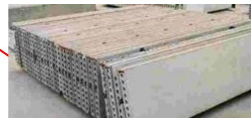
預製間隔牆 (建築組件)