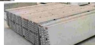
預製間隔牆 (建築組件)