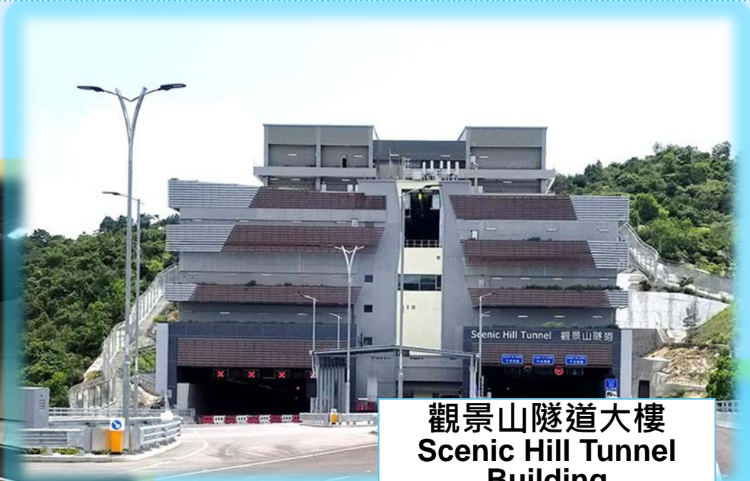
觀景山隧道大樓 Scenic Hill Tunnel Building