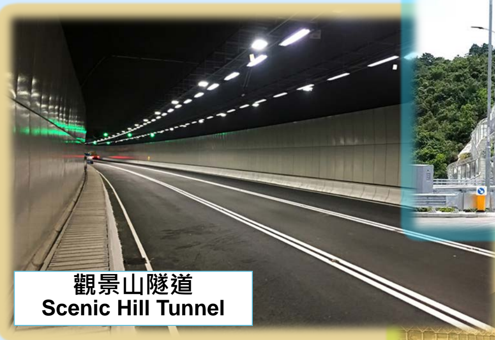
觀景山隧道 Scenic Hill Tunnel