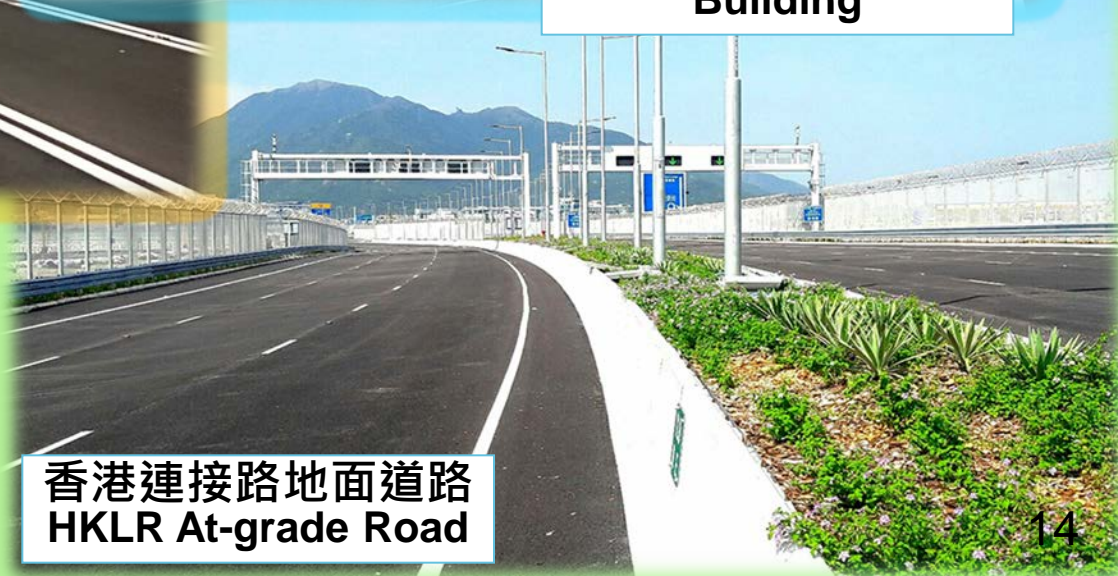
香港連接路地面道路 HKLR At-grade Road