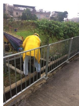
工程人員全面清理菜場下游的雨水排放渠道，以保持系統暢通。