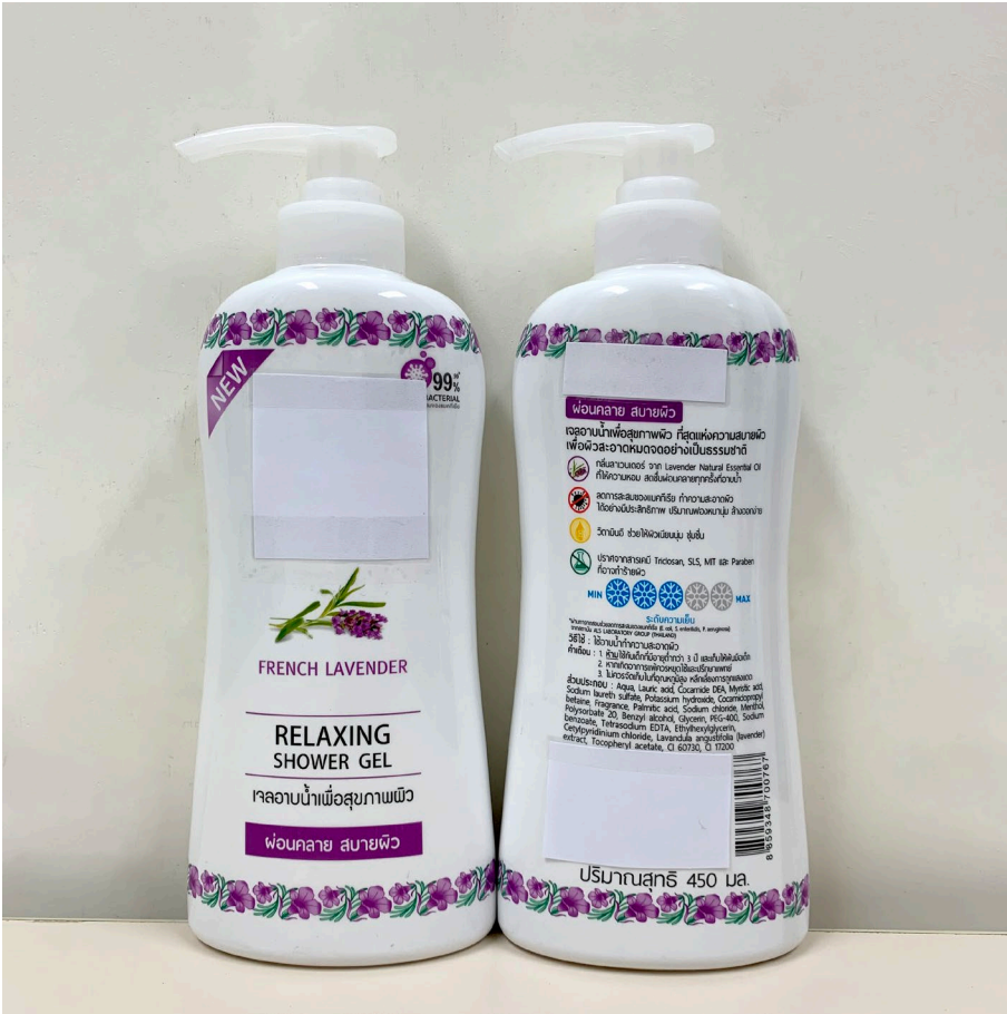
14 models of suspected law-breaking shower gels, household cleaning detergents and clothing bleach