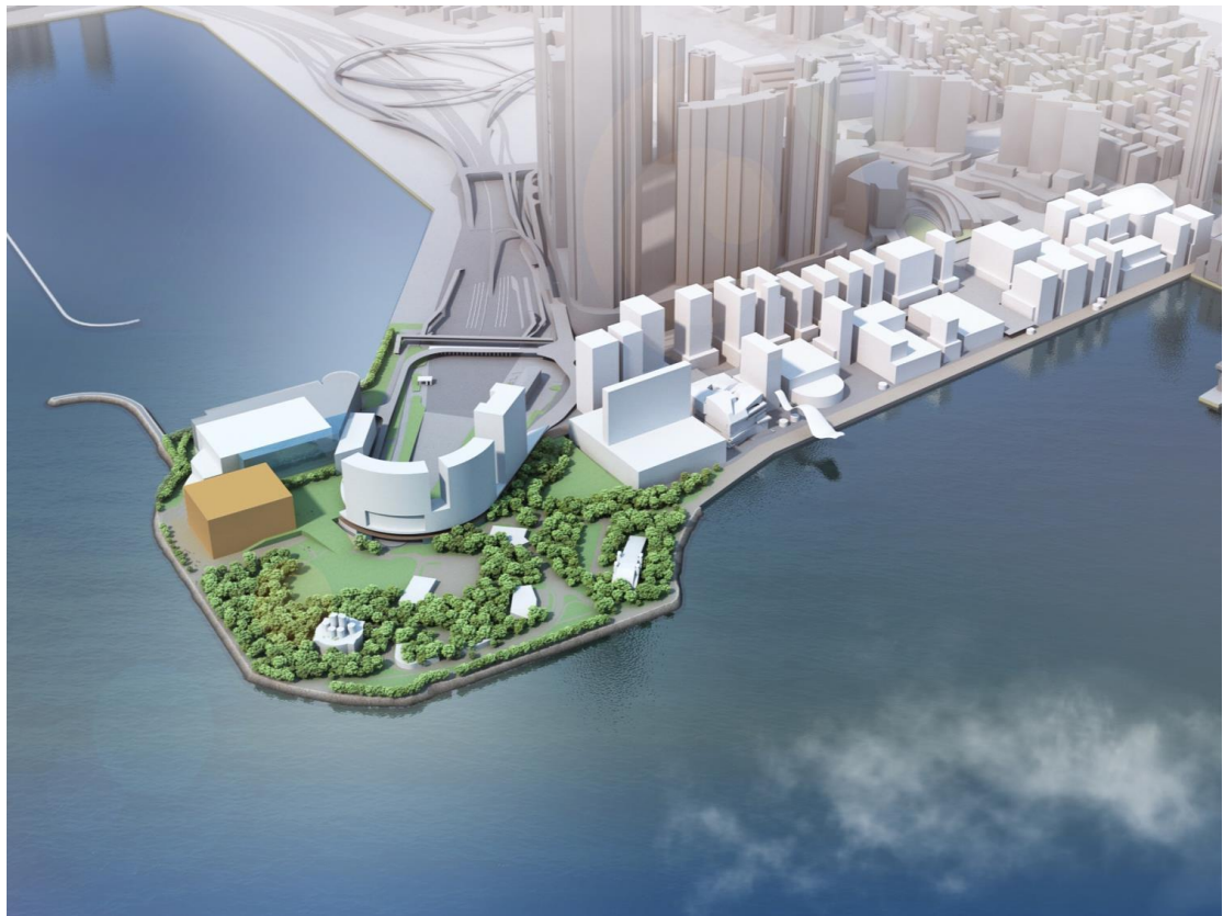
香港故宮文化博物館構想圖