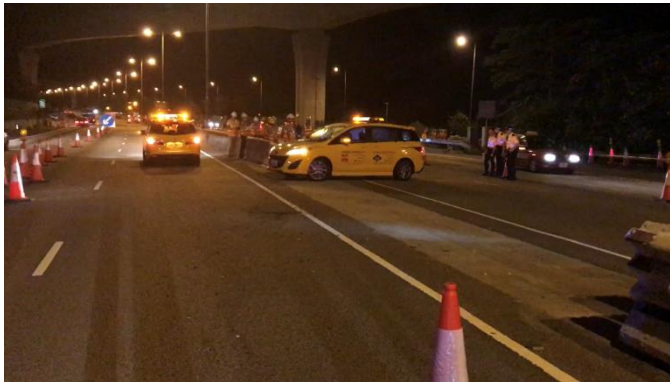
北大嶼山公路上事故演習