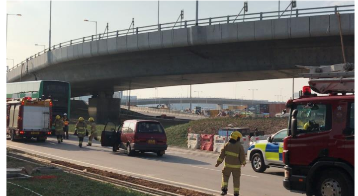
香港人工島上交通事故演習