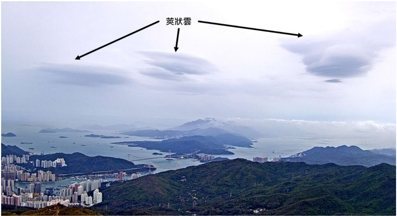
(圖四) 香港天文台網站今日(八月十九日)起加入在大帽山拍攝的實時天氣照片。圖示新增攝影機拍攝到的莢狀雲。