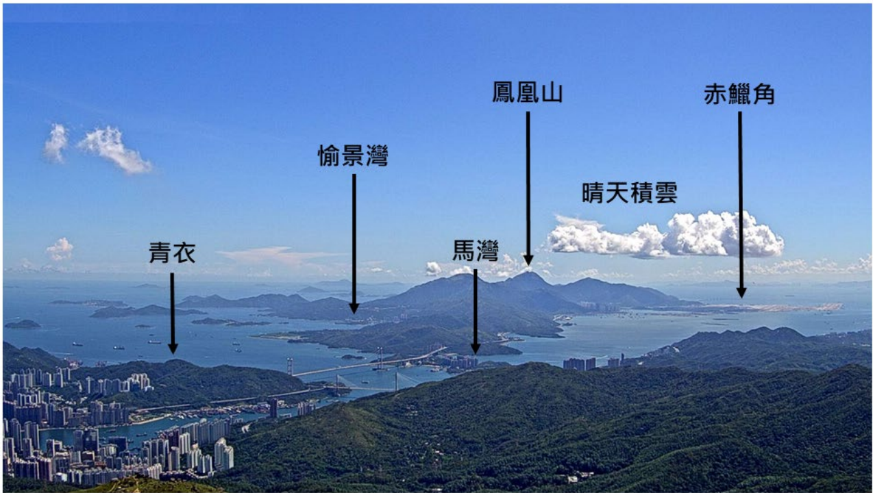
(圖一) 香港天文台網站今日(八月十九日)起加入在大帽山拍攝的實時天氣照片。圖示新增攝影機所拍攝的晴朗天氣，在大嶼山上空可見晴天積雲。