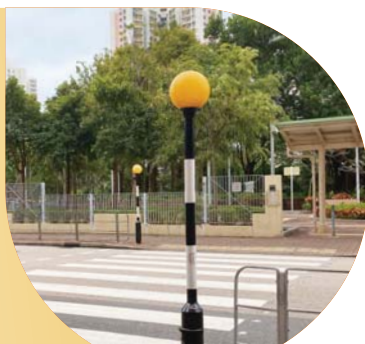
現時斑馬線黃波燈及黑白柱