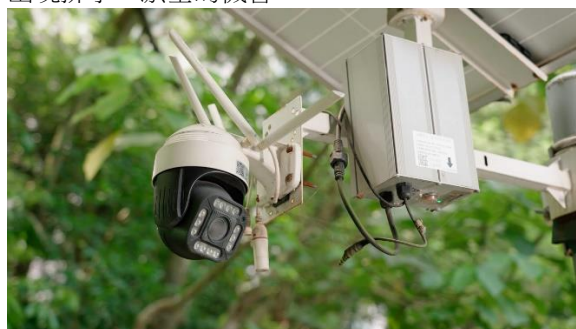
監測系統可實時監測排水口情況，適時作出跟進。