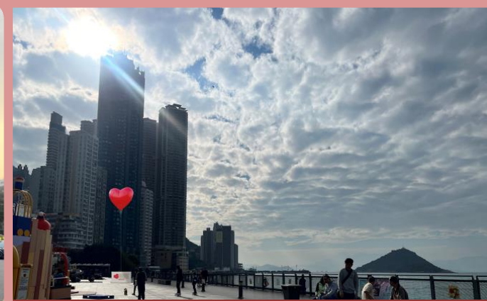
堅尼地城卑路乍灣海濱長廊 Belcher Bay Promenade, Kennedy Town