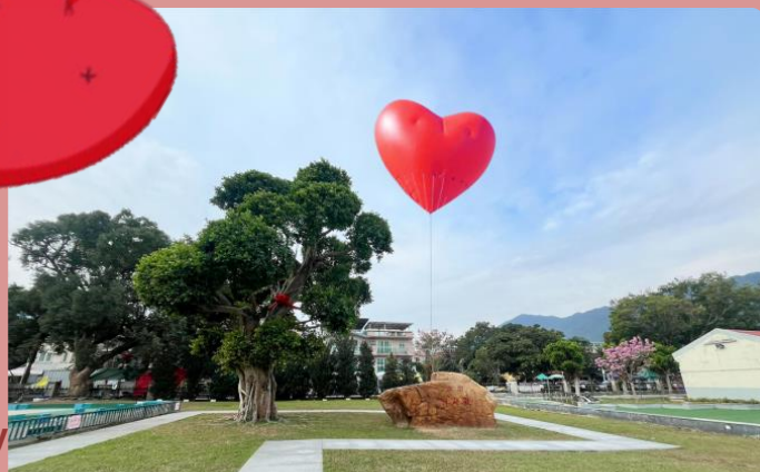
大埔林村許願廣場 Lam Tsuen Wishing Square, Tai Po