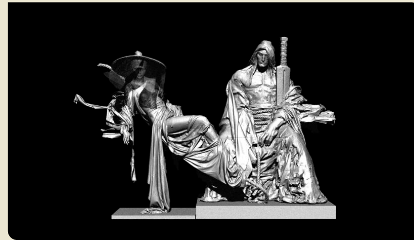
楊過與小龍女 《神鵰俠侶》 Yang Guo and Xiaolongnu in “The Return of the Condor Heroes”

主辦：康樂及文化事務署 | 聯合籌劃：香港文化博物館與穀雨文化發展基金 聯合策展：穀雨文化發展基金、滿紙煙雲文化產業及任哲工作室 | 支持機構：明河社