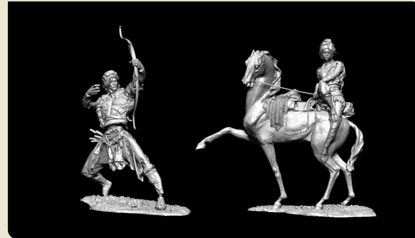
郭靖與黃蓉 《射鵰英雄傳》 Guo Jing and Huang Rong in “The Legend of the Condor Heroes”