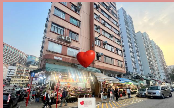
旺角花墟 Flower Market, Mong Kok