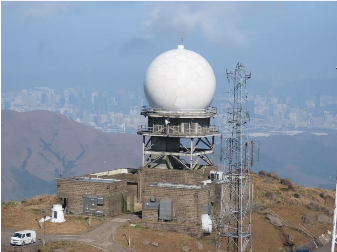
圖一 位於大帽山的新天氣雷達。