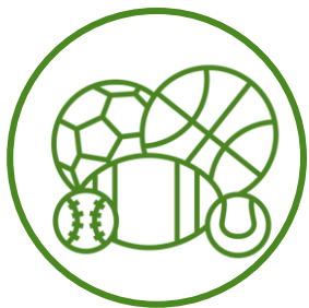
球類 Ball Games