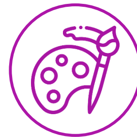
藝術文化 Arts & Culture