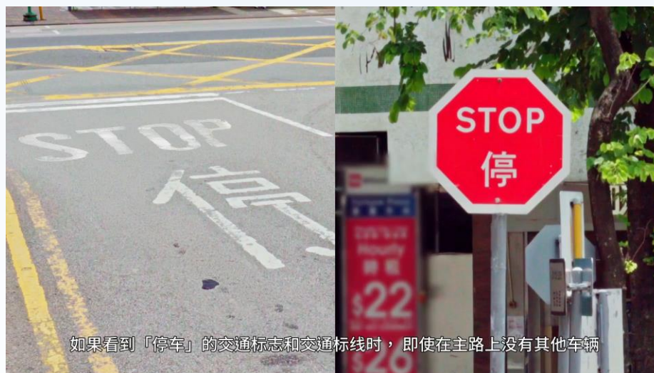
《交通標誌和道路標記篇》